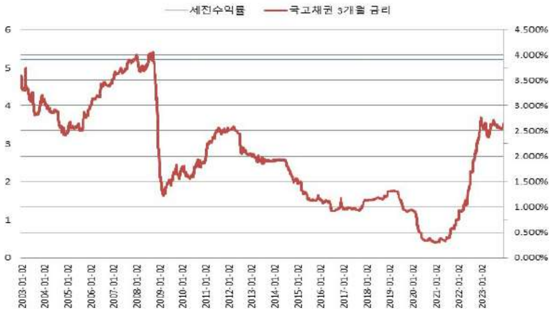
BNK투자증권 제111호 BACKTEST(간투)