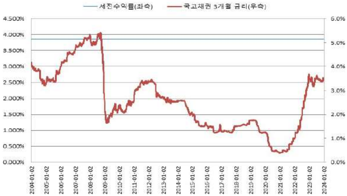
BNK투자증권 제113호 BACKTEST(간투)