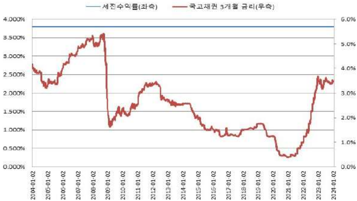
BNK투자증권 제115호 BACKTEST(간투)